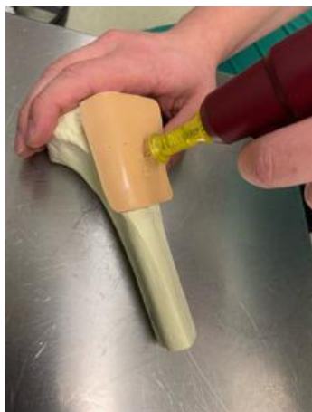
Abb.2 Punktion mit Bohrer