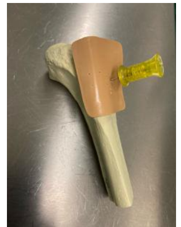
Abb.3 Nadel mit Mandrain