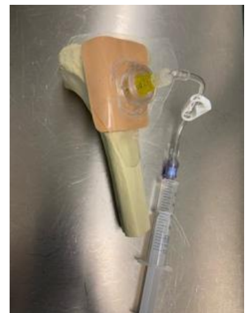
Abb.4 Fixierter io. Zugang